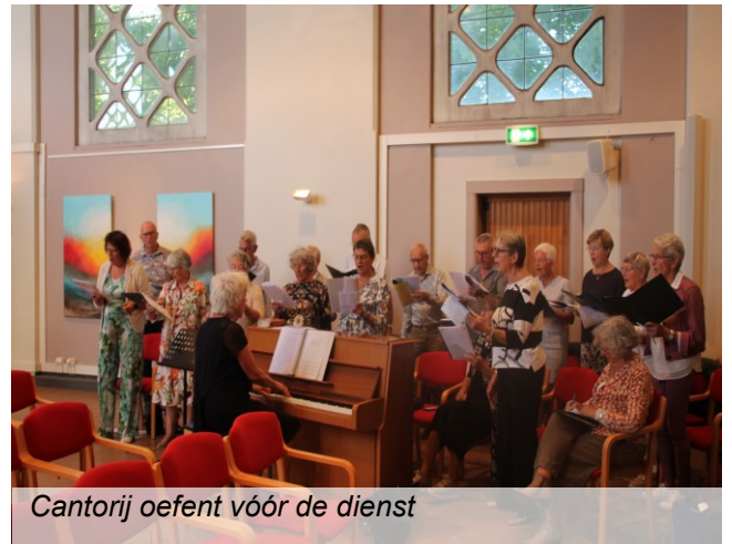
Cantorij oefent vóór de dienst

We zijn een zingende gemeente en ééns per maand werkt de cantorij mee aan de dienst. Onze cantorij bestaat momenteel uit 22 personen. Indien mogelijk worden muzikanten met verschillen instrumenten verwelkomd.