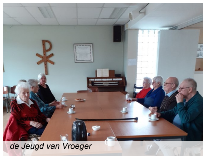
de Jeugd van Vroeger

Verder is er samenwerking met de Vrije Evangelische Gemeente in Nieuwvliet.